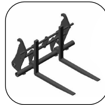
Horquillas para enganche rápido