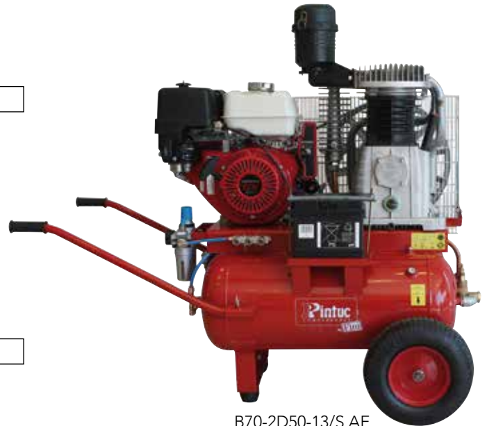
B70-2D50-13/S AE B70-2D50-13/S AP AE