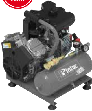
EXTREME 5G 7LT