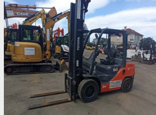
TOYOTA 028FDF30 DIESEL 3 Tn 2010 | 4.662 h