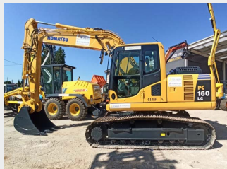
KOMATSU PC160LC-8 17 Tn 2011 | 7.574 h