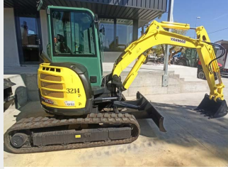
YANMAR VIO 50-U 5 Tn 2015 | 4.260 h