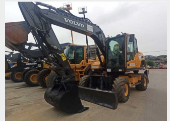
VOLVO EW140D 16 Tn 2012 | 12.460 h