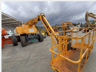
HAULOTTE HA 32 PX 32 M 2004|7.015 h