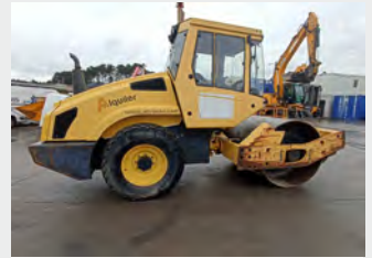
BOMAG BW 177 D-4 7 Tn 2008|3.190 h