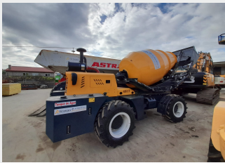
AUTOHORMIGONERA 2600 L NUEVA | 8 h