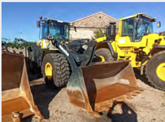
KOMATSU WA250PZ-5 14 Tn 2008 | 6.646 h