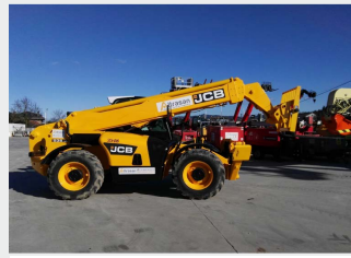
JCB MT 535-140 14 M 2011 | 3.093h