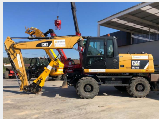
CATERPILLAR M316D 18 Tn 2012 | 10.412 h