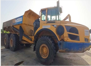
VOLVO A 35 F 2011|13.734 h