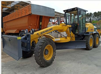
NEW HOLLAND F 156.6/A 2008