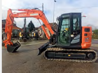
HITACHI ZX85USB-5A 9 Tn 2016 | 4.619 h