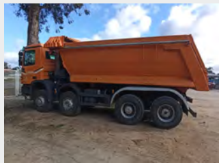
MERCEDES BENZ 4144K 2007|511.282 Km