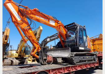
HITACHI ZX135US-6 14Tn 2019 | 2.441 h