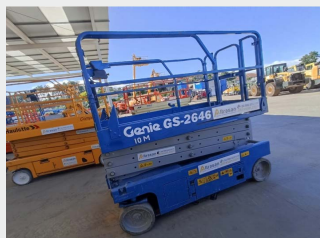
GENIE GS 2646 10 M 2009|178 h