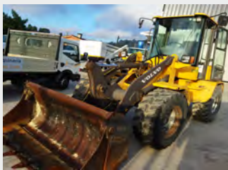
VOLVO L35B-Z 7 Tn 2010 | 4.872 h