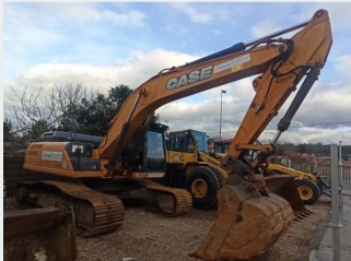
CASE CX300C 31 Tn 2012 | 8.267 h