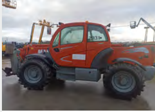
MANITOU MT 1840 18 M 2009 | 4.131 h