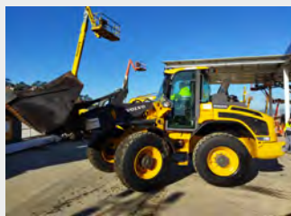
VOLVO L45H 9 Tn 2016 | 8.984 h