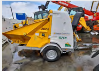
VIPER-ECIM E160 AF16 2007 | 753 h