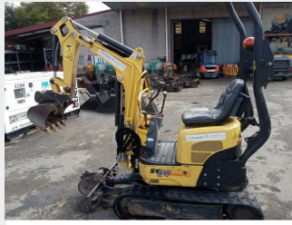
YANMAR SV 08-1A 1 Tn 2019 | 470 h