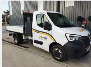
RENAULT MASTER TTE 2020|11.764 Km