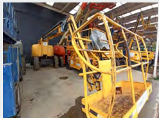
HAULOTTE HA260PX 26 M 2006|1.707 h