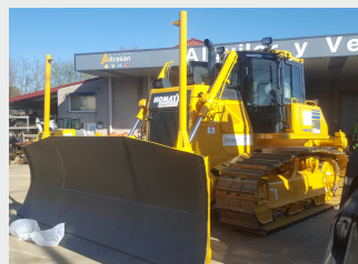
KOMATSU D65 WX 21 Tn 2014 | 9.836 h