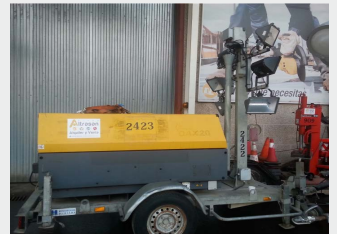
ATLAS QAX20 6 Focos 2008|1.041 h