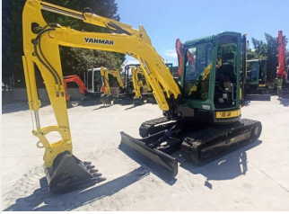
YANMAR VIO 50 5 Tn 2014 | 5.420 h