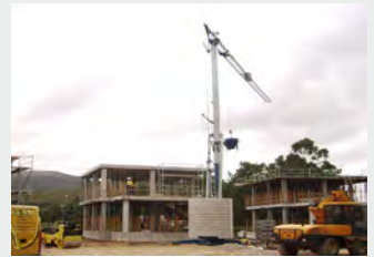
CRANES ITG 266.5A 26 M 2006