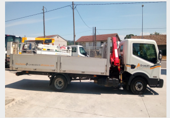
NISSAN NT400/FASSI F26A.0A23 2020| 51.728 Km