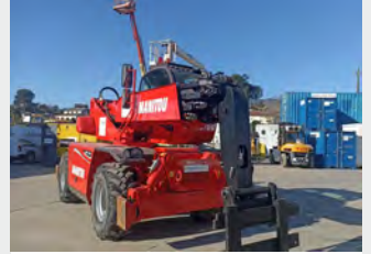
MANITOU MRT 2150 21 M 2016 | 2.774 h