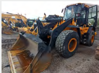
JCB 436 EZ 15 Tn 2011 | 7.442h