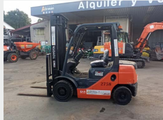
TOYOTA 8FDF25 DIESEL 2,5T 2008 | 5.823 h