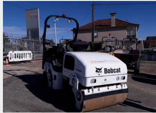
BOBCAT BCA 24 3 Tn 2003|1.161 h