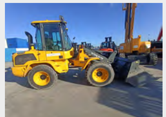
VOLVO L 30 G 6 Tn 2014 | 5.004 h