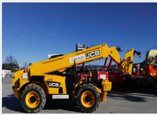
JCB 535-140 14 M 2011 | 3.270 h