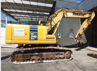
KOMATSU PC40NLC-10 25 Tn 2012 | 8.958 h