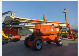
JLG 1250 AJP 40 M 2008|4.515 h