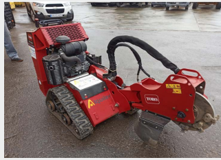
TORO STX 26 2017 | 339h