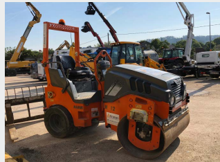
HAMM HD 12 VT 2,6 Tn 2011|2.074 h