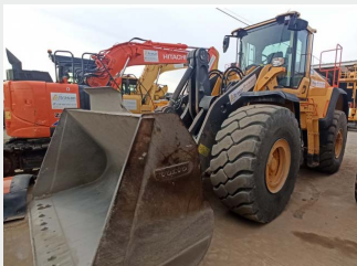
VOLVO L 150 H 26 Tn 2017 | 6.907 h