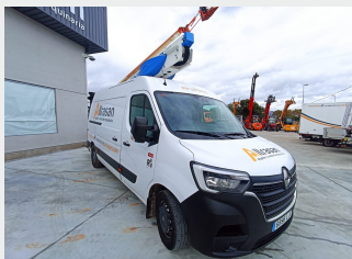
R. MASTER/SOCAGE 12 M 2020|19.905 Km/821 h