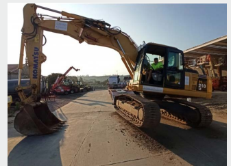
KOMATSU PC210LC-8 22 Tn 2009 | 10.485 h