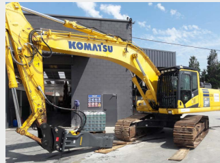
KOMATSU PC360LC-10 36 Tn 2012 | 11.793 h