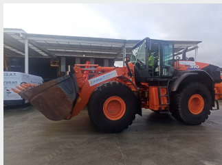
HITACHI ZW 310-6 24 Tn 2019 | 3.160 h