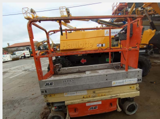
JLG 1930 ES 8 M 2007|591 h