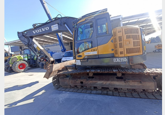
VOLVO ECR235DL 27 Tn 2015 | 9.905 h