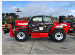
MANITOU MT 1436 R 14 M 2008 | 6.866 h