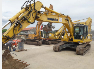
KOMATSU PC240NLC-8 25 Tn 2011 | 8.403 h