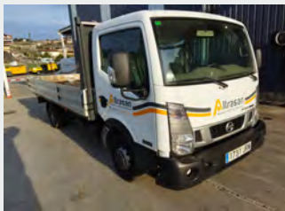
NISSAN NT400 2016|105.061 Km