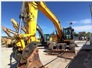
JCB JS 1752 W 18 Tn 2011 | 9.459 h