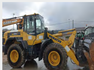
KOMATSU WA270-7 14Tn 2015 | 7.705 h