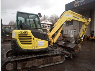
YANMAR VIO80-U 8 Tn 2013 | 5.862 h