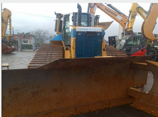
CAT D6 NLGP 19 Tn 2015 | 10.290 h