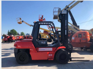
TOYOTA 5FD70 DIESEL 7Tn 2000 | 5.585 h