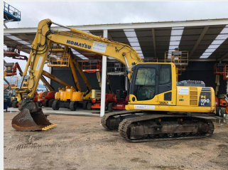
KOMATSUPC190LC-8 19 Tn 2011 | 7.296 h