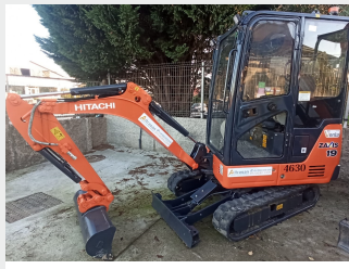
HITACHI ZX 19-5A CR 2 Tn 2017 | 2.125 h