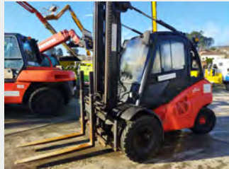
LINDE H50D-01 DIESEL 5Tn 2012 | 10.727 h