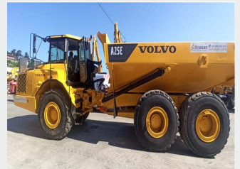
VOLVO A 25 E 2010|12.232 h