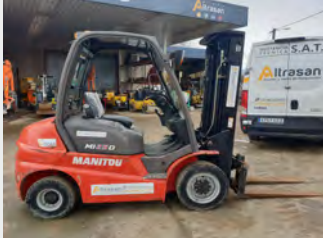
MANITOU MI25D DIESEL 2,5T 2015 | 3.633 h