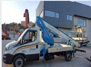
IVECO DAILY/SOCAGE 20M 2020|61.046 Km/4.158 h