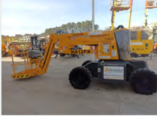
HAULOTTE HA12PX 12 M 2005|6.136 h