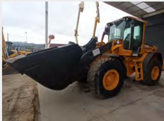
VOLVO L 90 F 17 Tn 2009 | 10.625 h