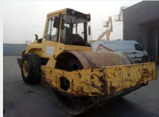
BOMAG BW 219 DH4 20 Tn 2007| 8.625 h