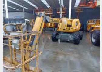
HAULOTTE HA18SPX 18 M 2007|634 h