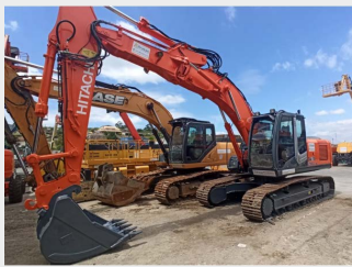
HITACHI ZX210LCN 21 Tn 2012 | 7.104 h