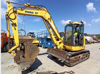
KOMATSU PC118MR-8 12 Tn 2012 | 4.818 h