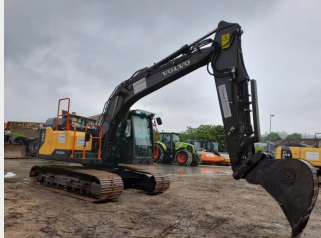
VOLVO EC140EL 14 Tn 2018 | 5.896 h