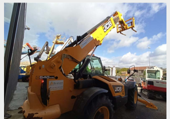
JCB 540-170 17 M 2014 | 2.841 h