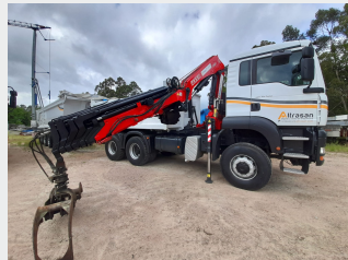
MAN TGA 33.360 2004|401.926 Km