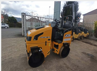
JCB VMT 160-100 2Tn 2014|648 h