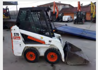
BOBCAT S 70 1,5 Tn 2018 | 532 h