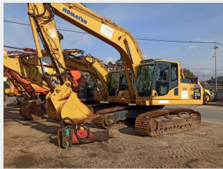
KOMATSU PC210LC-8 22 Tn 2012 | 8.434 h