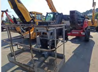
MANITOU 160ATJ 16 M 2007|5.062 h