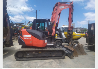
KUBOTA KX080-3 8 Tn 2015 | 4.733 h