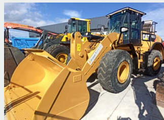
CATERPILLAR 950 K 24 Tn 2015 | 8.257 h