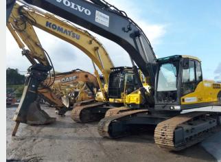
VOLVO EC240CL 26 Tn 2009 | 7.392 h