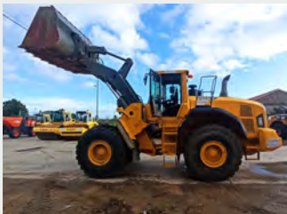
VOLVO L 180 G 30 Tn 2014 | 15.153 h