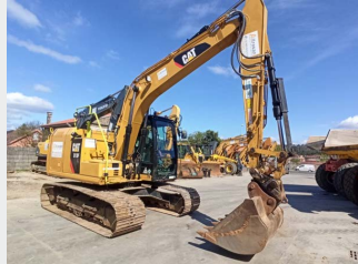
CATERPILLAR 313FL 14 Tn 2018 | 5.954 h