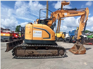
HYUNDAI HX145 LCR 16 Tn 2018 | 3.278 h