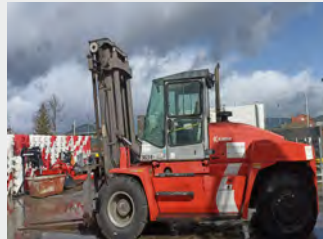
KALMAR DCE100-12 DIESEL 10T 2007 | 8.163 h