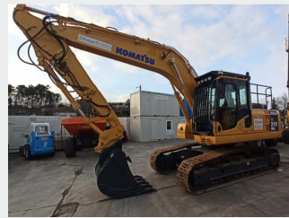
KOMATSU PC210NLC-8 22 Tn 2016 | 6.933 h