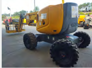
HAULOTTE HA16SPX 16 M 2007|4.949 h