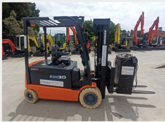
DOOSAN B30X-5 ELECTRICA 3Tn 2013 | 4.220 h