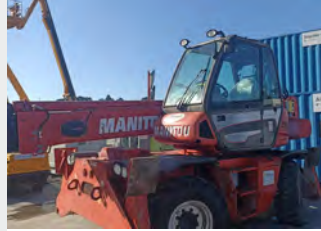
MANITOU MRT 1640 16 M 2012 | 5.139 h