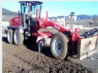
O&K F 156 A 2001 | 13.560 h