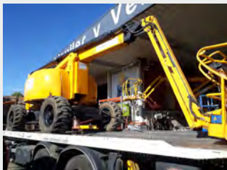
HAULOTTE HA20PX 20 M 2007|9.893 h