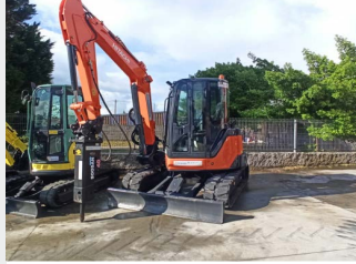
HITACHI ZX52U-3 5,5 Tn 2013 | 4.535 h