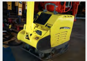
BOMAG BPR 45/55 2007