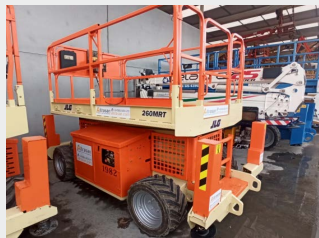
JLG 260 MRT 10 M 2008|762 h