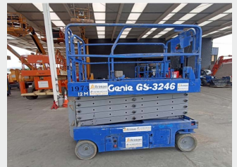
GENIE GS 3246 12 M 2007|645 h