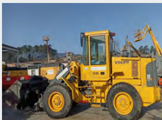
VOLVO L 50 E 10 Tn 2007 | 12.221 h