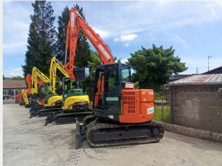
HITACHI ZX85USBLNC-3 9 Tn 2013 | 6.598 h