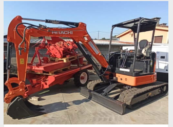
HITACHI ZX26U-5A 2,6 Tn 2016 | 3.310 h