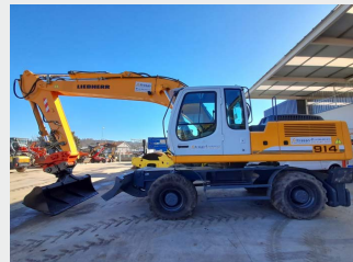
LIEBHERR A 914 23 Tn 2011 | 11.327 h