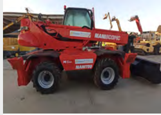
MANITOU MRT 1432 14 M 2006 | 6.406 h