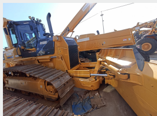
KOMATSU D61PX 19 Tn 2008 | 10.836 h