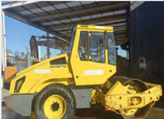
BOMAG BW 177 D-4 7 Tn 2006|2.950 h