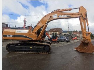
CASE CX330 35 Tn 2007 | 8.844 h