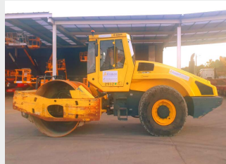
BOMAG BW 219 DH-4 19 Tn 2009|10.021 h