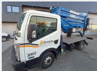
NISSAN 35.13/CTE ZED 20 M 2018| 21.341 Km/1.958 h