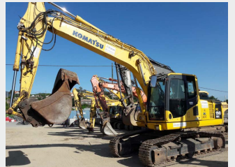
KOMATSU PC190LC-8 19 Tn 2011 | 6.331 h