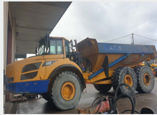
VOLVO A 40 F 2012|13.589h