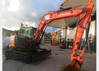
HITACHI ZX 85USBLNC-3 9 Tn 2013 | 4.880 h